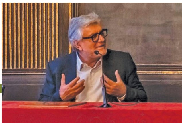
Giancarlo De Cataldo

Scrittore, ex magistrato e sceneggiatore nato a Taranto nel 1956, Giancarlo De Cataldo ha la paternità del famoso Romanzo criminale , sul quale è tornato: quando lo scrisse non immaginava che quel libro gli avrebbe cambiato l'esistenza, ha confidato recentemente, difendendo il prodotto assimilabile a Gomorra , circa il rischio di trasformare gli eroi negativi in modelli di riferimento ("se volete che la gente smetta di identificarsi con i criminali, fatela vivere meglio"). Il pericolo è sempre costante. Ma la stessa gente sa dove conducono certe storie, potremmo aggiungere, prendendole ad esempio. Ovvero quali non hanno l'happy end.