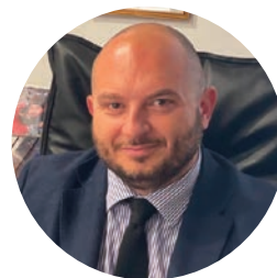
di GIUSEPPE LOSAVIO Commercialista

Fondamentale per la diagnosi della patologia è l'esame clinico del paziente