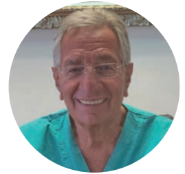
di GUIDO PETROCELLI Medico Ortopedico

La Sig.ra C.R. di anni 59 ci chiede informazioni sull'artrosi e come prevenirla o curarla.