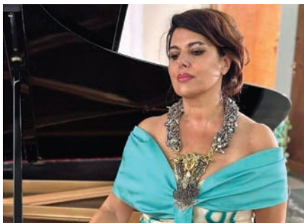
Il soprano Angelica Cirillo

L'edizione "in coming" vedrà i Principi Giuliano e Fabrizia Dentice di Frasso aprire le porte della loro meravigliosa dimora per accogliere i pregevoli ospiti e quanti vorranno partecipare alla suggestiva serata di gala. L'evento, che si preannuncia come tra i più mondani