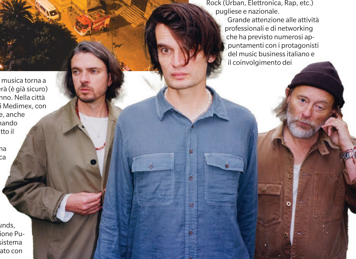
The Smile

The Smile (con la prima data in Italia), Pulp (unica data italiana) e The Jesus and Mary Chain (unica data Sud Italia) sono i grandi protagonisti del mainstage dell'International Festival & Music Conference promosso da Puglia Sounds, il programma della Regione Puglia per lo sviluppo del sistema musicale regionale attuato con