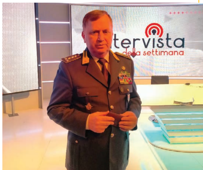
A illustrare la relazione semestrale 2023 è stato il Generale di Corpo d'Armata Michele Carbone

La Relazione Semestrale DIA sull'attività svolta e risultati conseguiti dalla Direzione Investigativa Antimafia nel primo semestre del 2023 conferma come le organizzazioni mafiose, da tempo avviate ad un processo di adattamento ai diversi contesti socio-economici ed alla penetrazione dei settori imprenditoriali, abbiano sostituito l'uso della violenza, sempre più residuale ma mai ripudiato, con strategie di silenziosa infiltrazione e con azioni corruttive . Questo cambiamento nella gestione delle relazioni con l'esterno è dimostrato, da un lato, dalle numerose indagini condotte sull'accaparramento di appalti e servizi pubblici e, dall'altro, dagli omicidi commessi in contesti di mafia, soprattutto nel territorio campano e pugliese, e i sequestri di armi effettuati anche in questo semestre. Questo cambiamento di strategia relazionale permette alle mafie di insinuarsi in contesti "sani" imprenditoriali allo scopo di cercare sbocchi per investire capitali illegali in attività legali. L'uso della tecnologia assume un ruolo determinante per l'attività illecita delle organizzazioni criminali , che con sempre maggiore frequenza utilizzano i sistemi di comunicazione crittografata, le molteplici applicazioni di messaggistica istantanea e i social.